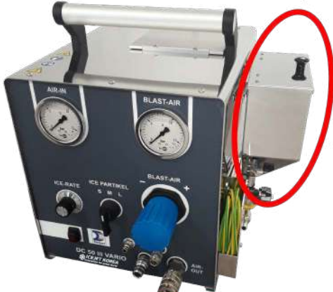
Abrasive set 장착위치