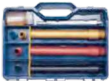
(케이스 미포함, 무색)