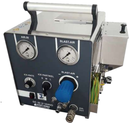
(DC50 Vario 본체)